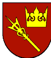
Starostwo Powiatowe w Nowym Targu