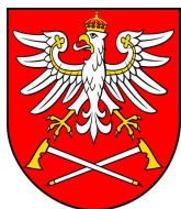
Miasto i Gmina Czarny Dunajec